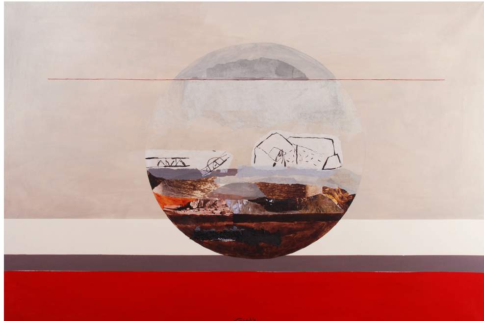
Iz cikla Vmesni prostor, 100 x 150 cm, 2013, platno