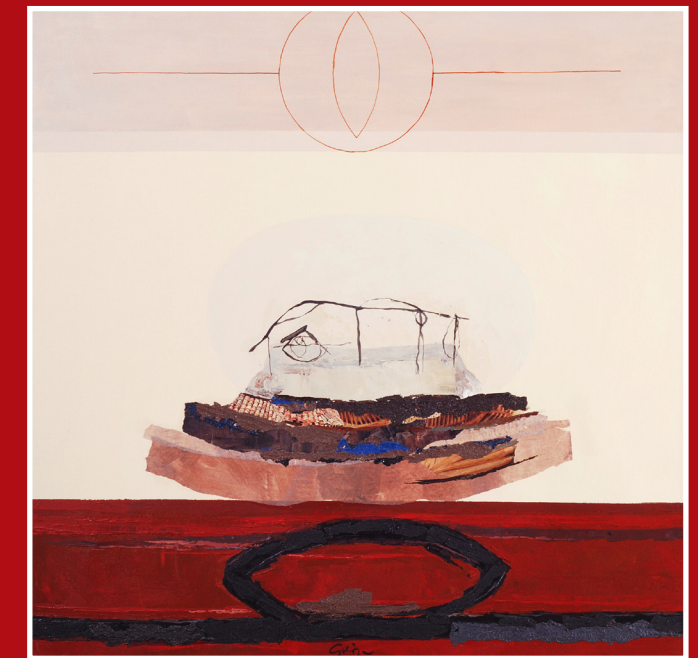
Iz cikla Vmesni prostor, 80 x 80cm, 2013, platno