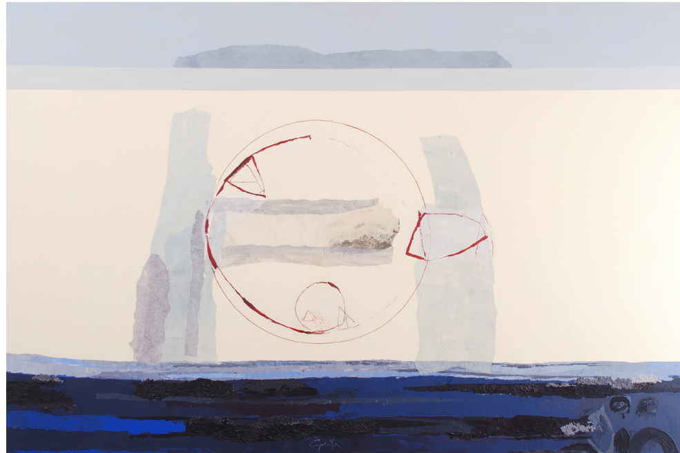
Iz cikla Vmesni prostor, 100 x 150 cm, 2013, platno