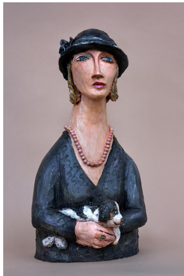
Kiparka s Princeso Sissi, poslikana žgana glina, 46 cm × 26 cm × 25 cm, 2008

IZDAL: Premogovnik Velenje, zanj dr. Milan Medved RAZSTAVNI PROSTOR: Muzej premogovništva Slovenije, Partizanska 78 DATUM: 7. 2. 2013 - 15. 3. 2013 ORGANIZACIJA: Stojan Špegel POSTAVITEV RAZSTAVE: Stojan Špegel, Katjuša Rojac IDEJNA ZASNOVA ZLOŽENKE: Stojan Špegel OBLIKOVANJE: Ivo Hans Avberšek TISK: STUDIO HTZ