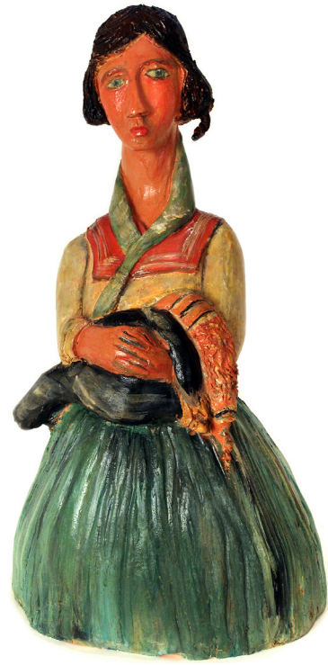
Ciganka z otrokom, poslikana žgana glina, 43 cm × 25 cm × 22 cm, 2004