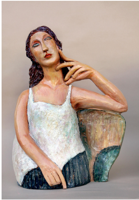
Jeanne Hébuterne v srajčki, poslikana žgana glina, 54 cm × 44 cm × 21 cm, 2012