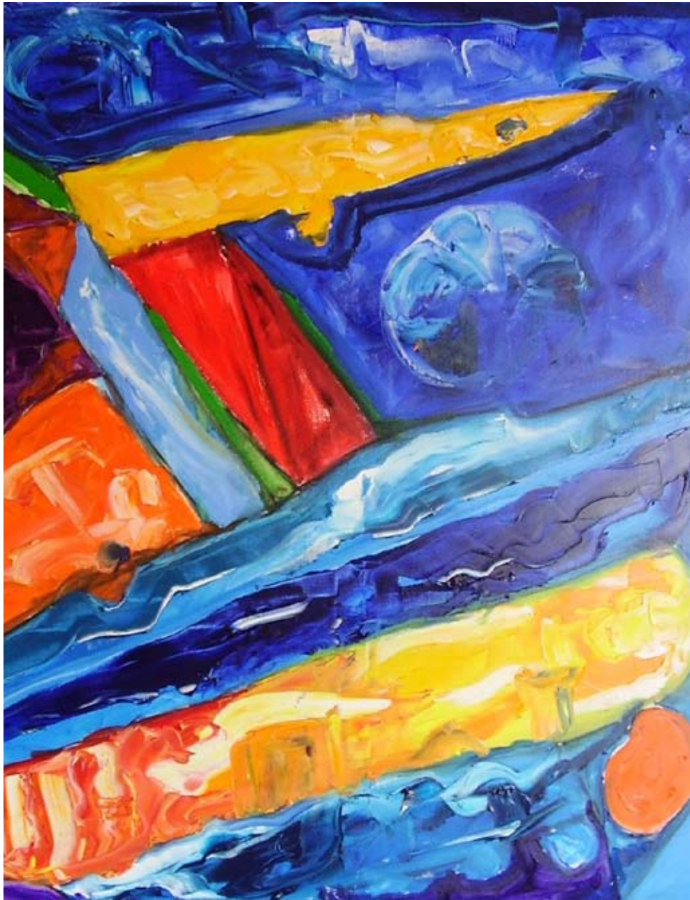
Plavi planet, 2006, olje na platnu, 100 x 120 cm