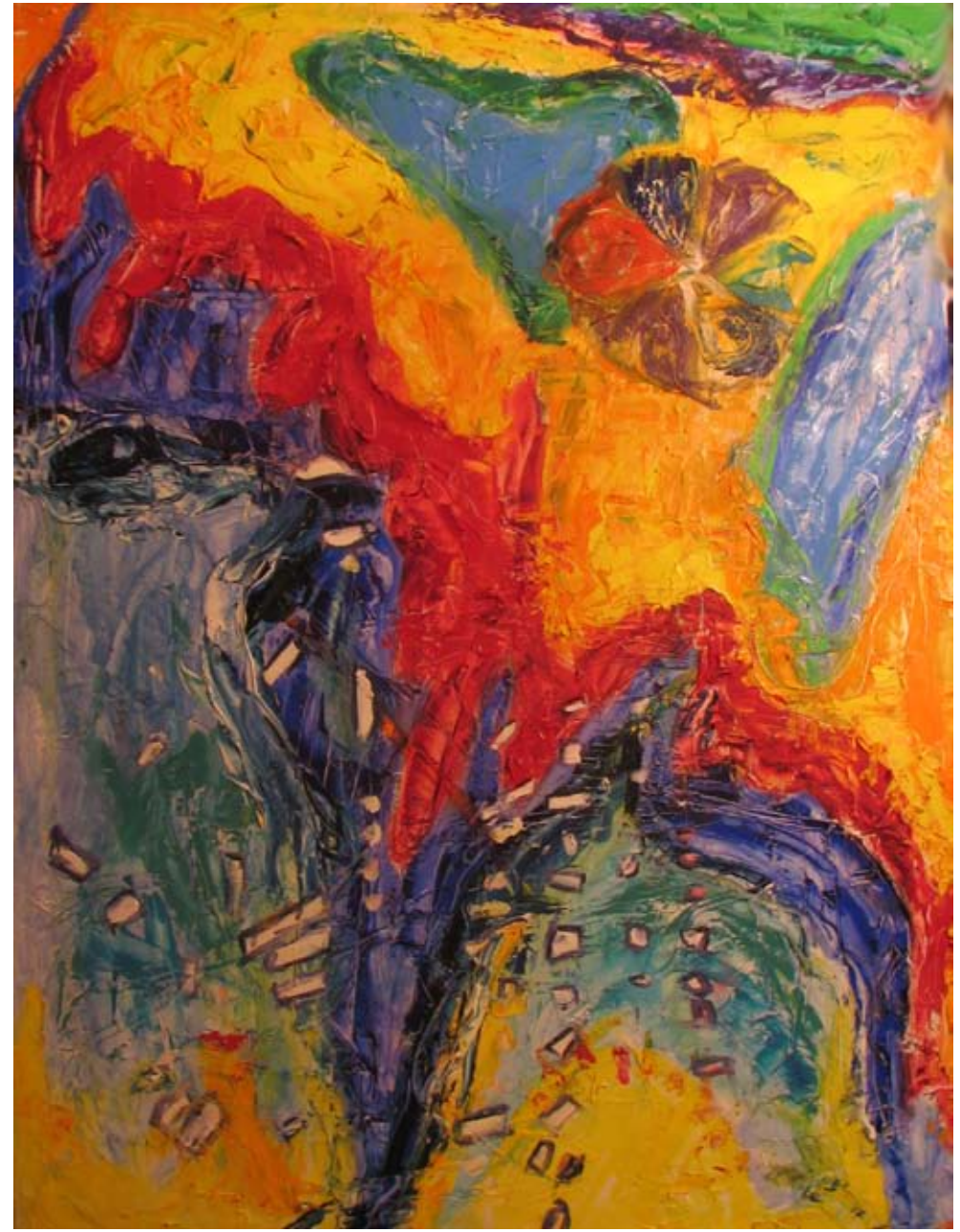
Feniks, 2006, olje na platnu, 90 x 120 cm