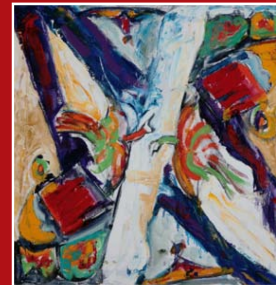
Simetrija je rdeča , olje na platnu, 65 cm x 65 cm, 2008