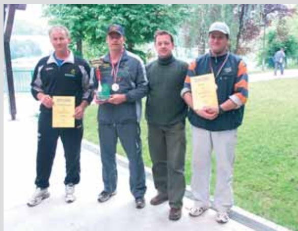
Najboljši ribiči prvih treh ekip: v sredini predstavniki HTZ IP, ki so prejeli prehodni pokal.

ekipe: 1. HTZ IP, 33 točk , 2. ESD, 43, 3. Proizvodnja, 69, 4. Klasirnica, 107, 5. Zračenje, 122, 6. Priprave, 141.