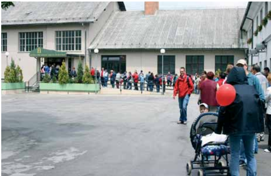
Dolga vrsta pred Muzejem premogovništva Slovenije, ki jo bo gotovo težko ponoviti.

presenetijo urejene površine in lepo okolje na nekdanj poškodovanih površinah. To je zasluga Premogovnika Velenje, ki je rekultiviral te površine in jim dal novo kakovost.