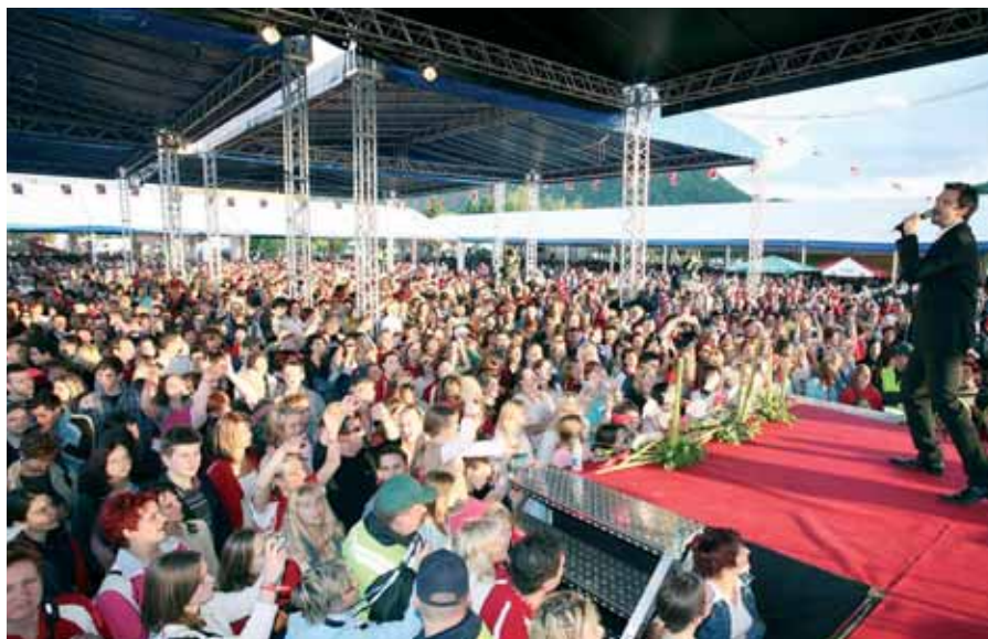
Na Dan Mercatorja so povabljeni vsi zaposleni in njihovi ožji družinski člani. Letos jih je bilo skoraj 5.000 več kot lani.

nato podjetju BIRT za dobro sodelovanje in odlično organizacijo, sodelavcem HTZ IP za ureditev infrastrukture, MO Velenje za podporo. Nenazadnje gre zahvala tudi vsem prebivalcem Velenja za potrpežljivost ob povečani gneči v mestu.