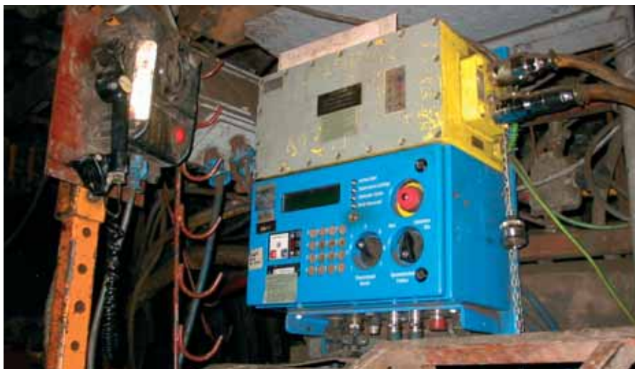
Sodobna upravljalna postaja v jami

Rudar: »Ali sodelavce na kakšen način spodbujate k varčevanju in jih nagradjate oziroma jih boste?«