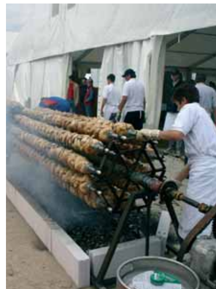
Nahraniti je bilo treba 22.500 ljudi.

Pušnik: »Letos smo se zelo potrudili pri trženju centra in naredili veliko za promocijo. V tem smislu bomo v kratkem postavili šest oglaševalskih tabel, predvsem za proizvajalce športne opreme. S