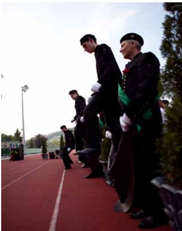
Čez sode se je ob pomoči starešin podalo 58 novincev.