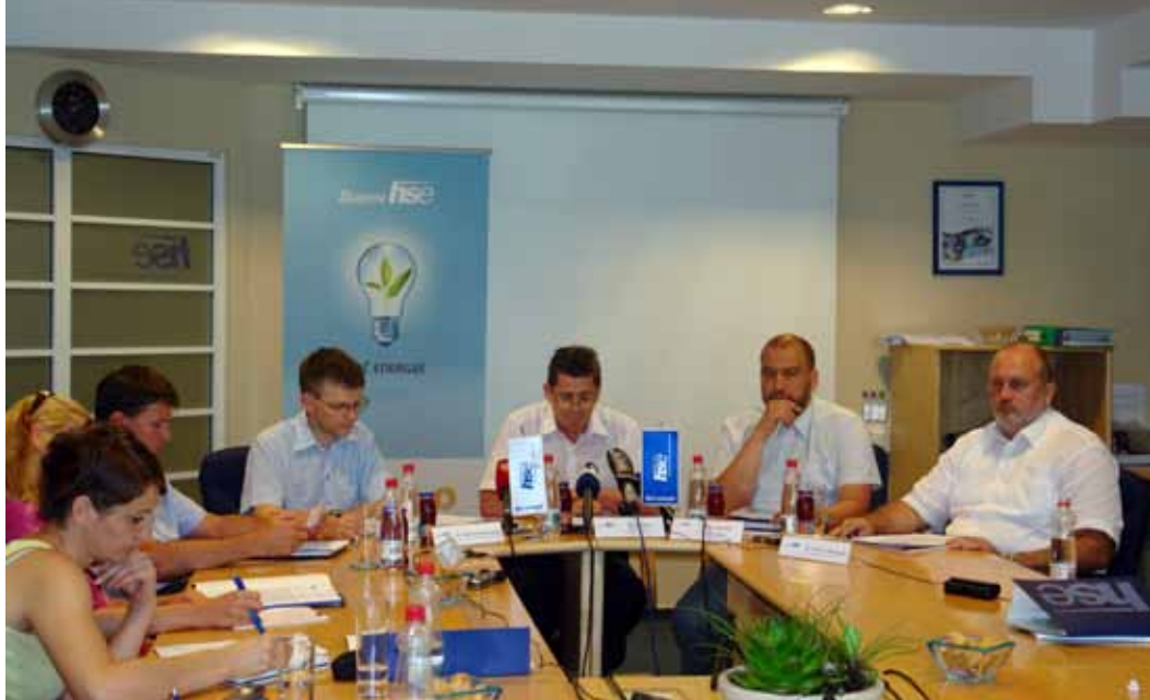
Na novinarski konferenci v HSE so javnosti predstavili aktualne študije in zadnje javne polemike o gradnji bloka 6 Termoelektrarne Šoštanj

Potrjene odkopne zaloge s presečnim datumom 31. 12. 2008 so znašale 131.670.000 ton premoga, kar potrjuje