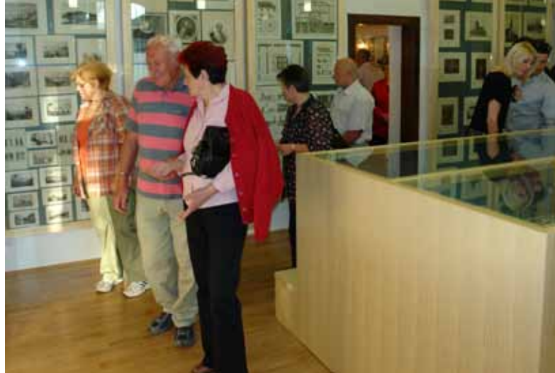
Slovesnosti ob odprtju Mayerjeve vile so se udeležili predvsem številni Šoštanjčani in bili nad videnim navdušeni.