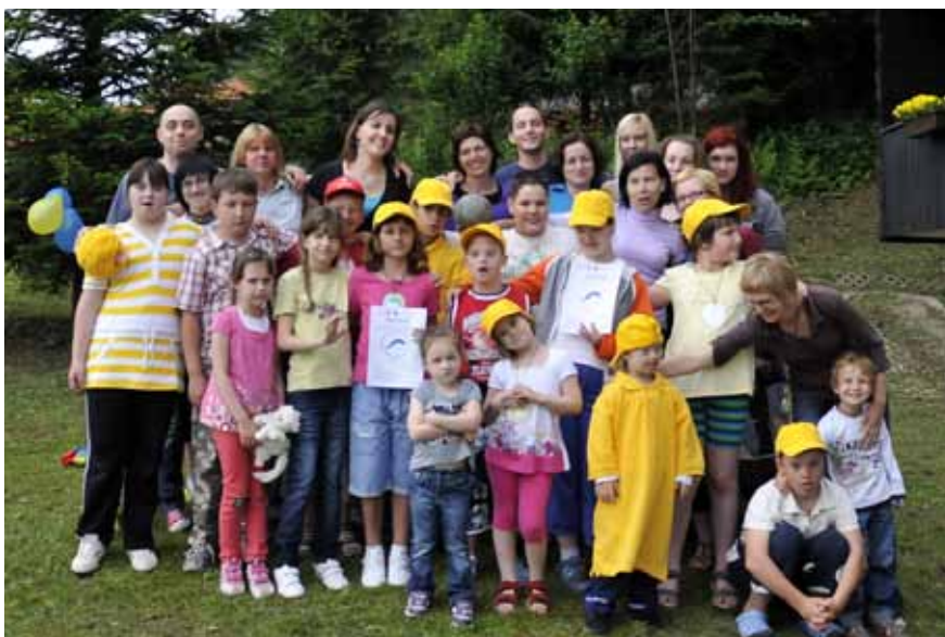
Zaključni piknik plavalne skupine Delfinčki – prostovoljci in plavalci – pri Lukovi vili