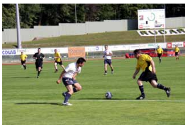
Pred člansko tekmo Rudarja in Šmartnega so se v vročem popoldnevu za žogo podili tudi veterani obeh moštev; boljši so bili gostitelji – NK Rudar NK Šmartno 3:2.