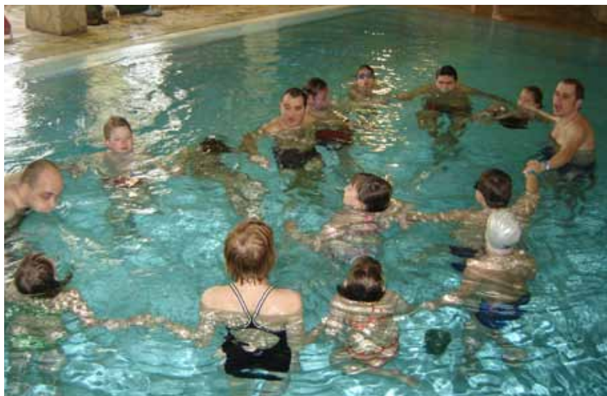
Igre v vodi na zimskem vikendu na Rogli

Plavalna skupina Delfinčki, ki deluje pod okriljem Plavalnega kluba Velenje, je skupina s posebnimi potrebami, ki se uči plavanja po metodi Halliwick. Omenjena metoda temelji na filozofiji, ki poudarja pomen prijetne izkušnje, zadovoljstva, veselja, sproščenosti ter tesnega sodelovanja med učencem in vaditeljem. Znanje nadgrajujemo na osnovi že usvojenega znanja in spretnosti. Halliwick metoda pripisuje velik pomen tudi prostovoljskemu delu.