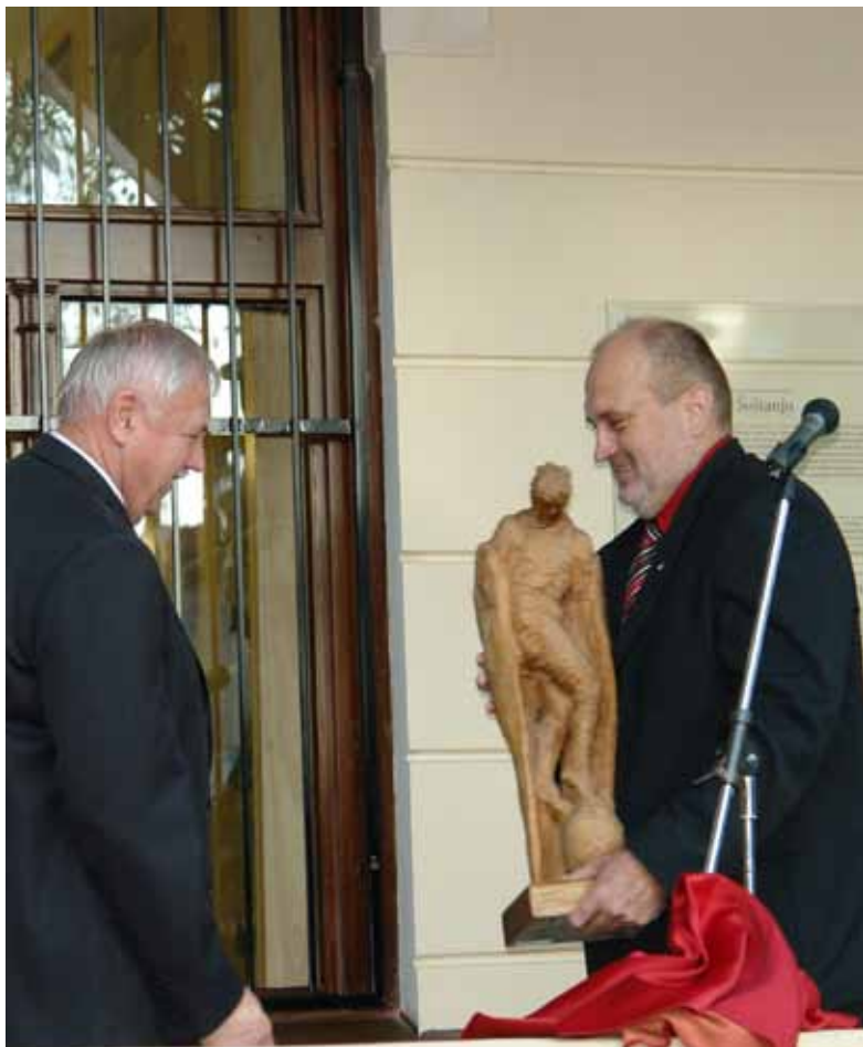
Napotnikov Ikarus v lasti Premogovnika Velenje se je pridružil stalni zbirki Napotnikovih del v prvem nadstropju Mayerjeve vile.