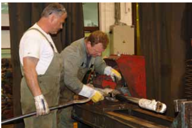
V inovacijsko dejavnost se lahko vključi vsak sodelavec.

Ob tem se je veliko samoizobraževal na področju računalništva, vodil je tudi računalniške tečaje za otroke in odrasle, saj zelo rad dela z otroki in nasploh z ljudmi. Preden se je zaposlil v HTZ Velenje je deset let delal v Agrini Informatiki v Žalcu, najprej kot programer poslovnih aplikacij, zadnja tri leta pa kot vodja projektov izvajanja programa trgovinske opreme. Bil je tudi predstavnik vodstva za kakovost.