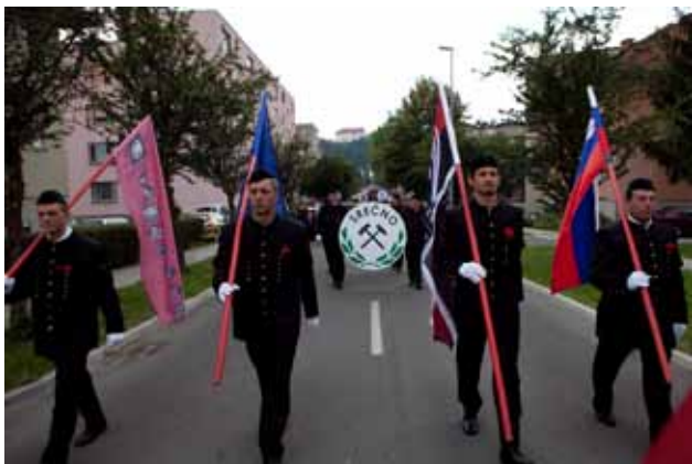
Jubilejni, 50. Skok čez kožo je bil dokaz, da je Velenje rudarsko mesto in bo to še dolgo ostalo.