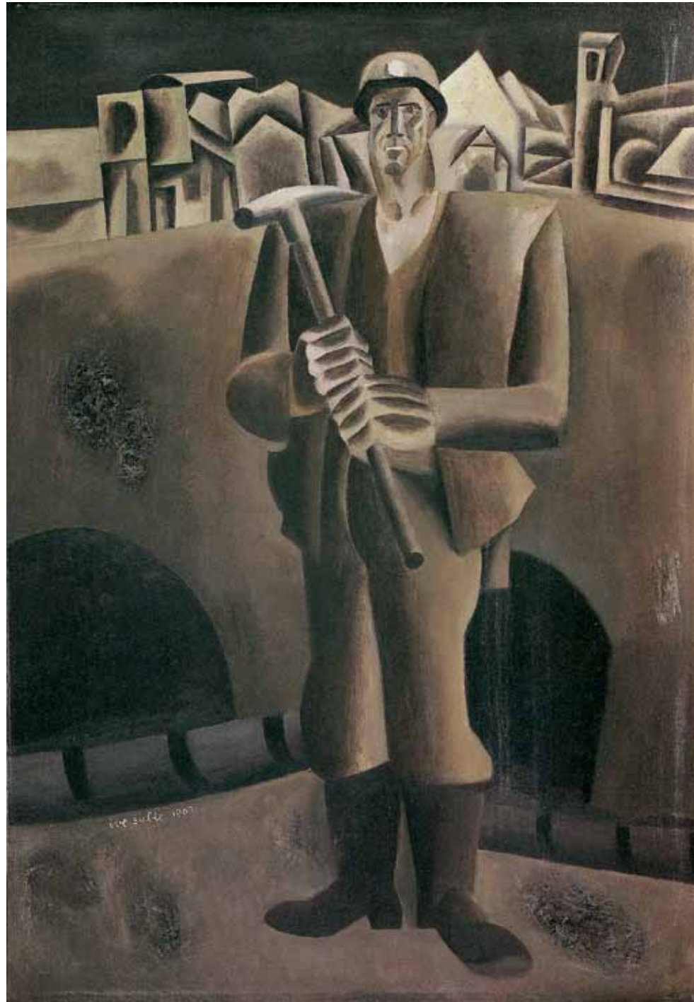
Ive Šubic Rudar, olje na lesu, 98,5 x 68,5 cm, 1966 Miner, oil on wood, 98,5 x 68,5 cm, 1966