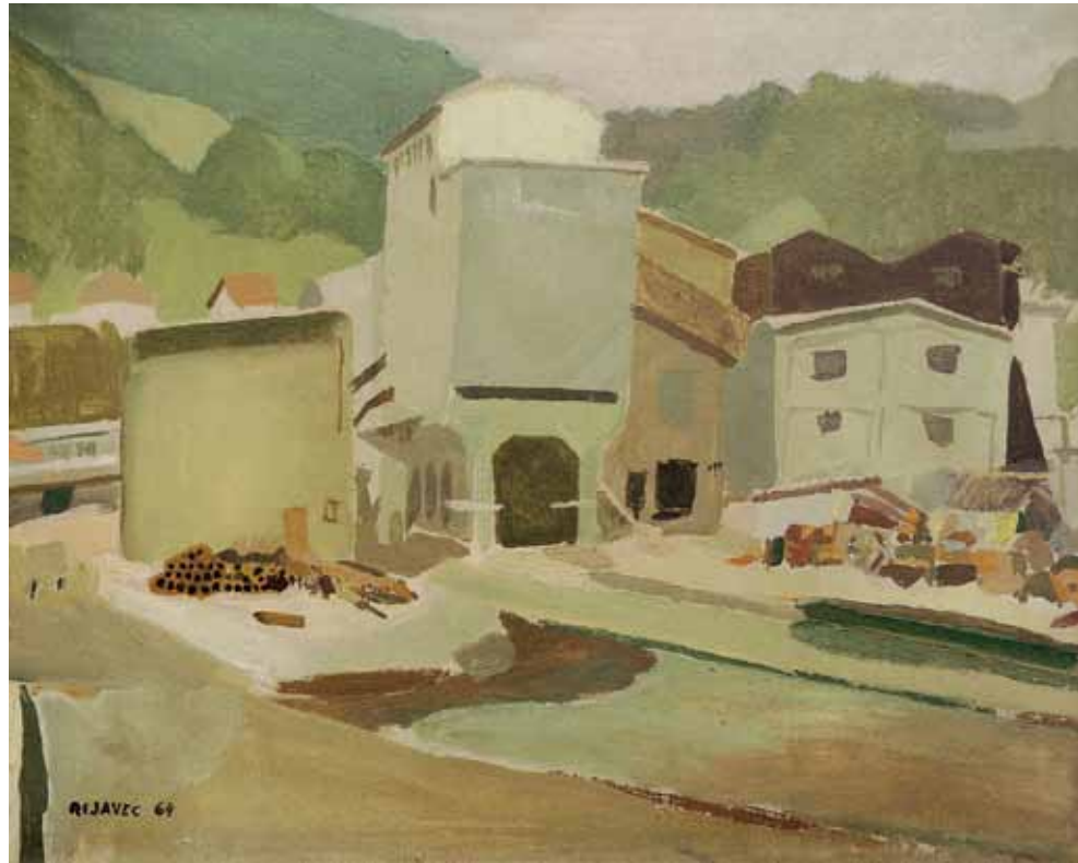
Milan Rijavec Separacija II, olje na platnu, 48 x 60 cm, 1964 Screening II, oil on canvas, 48 x 60 cm, 1964