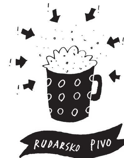
Bergmandeljčevo pivo del ustripljene zgodbe tuš, računalniška grafika, 2010