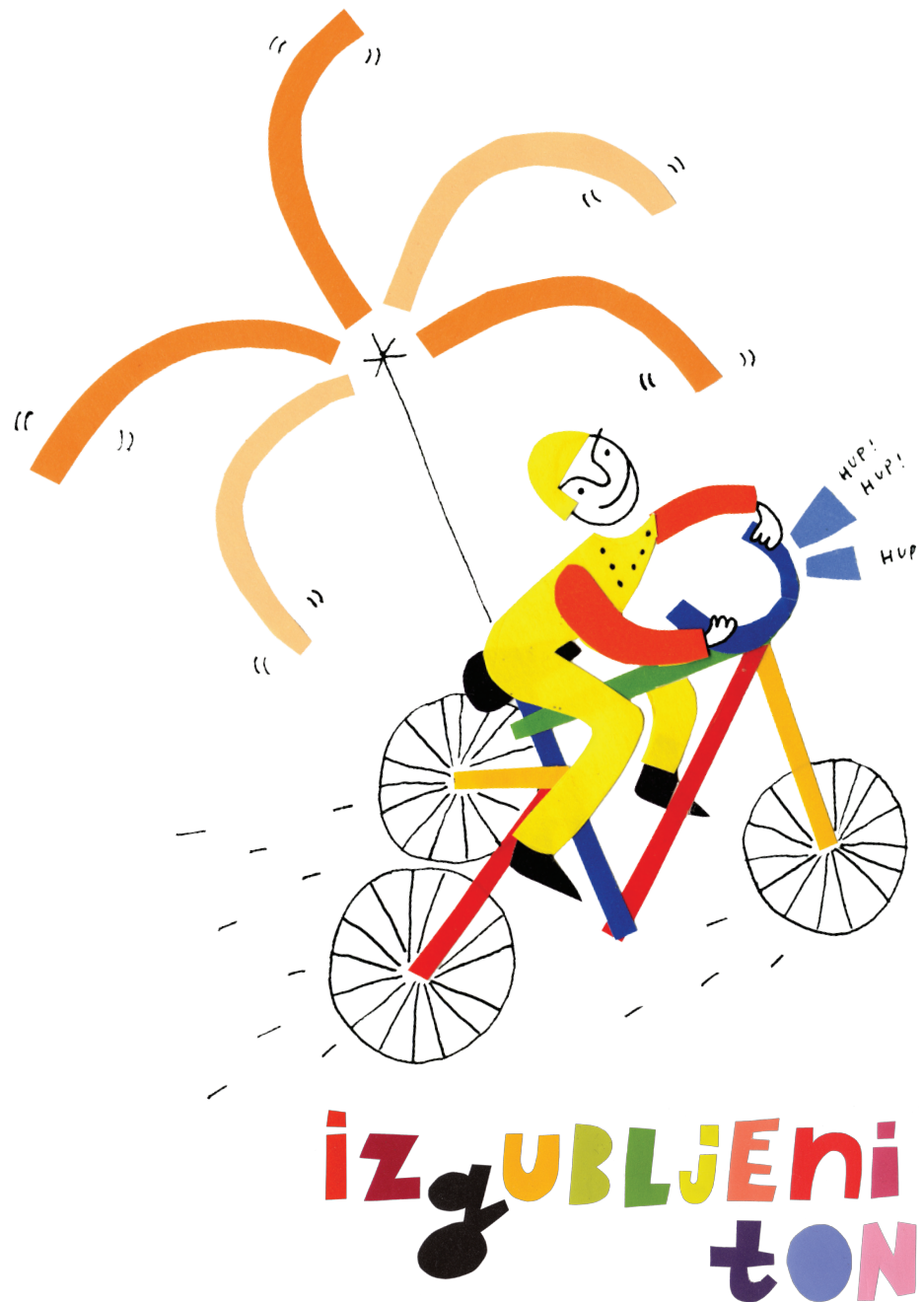
Mali kolaž za gledališki list predstave Izgubljeni ton , 2010